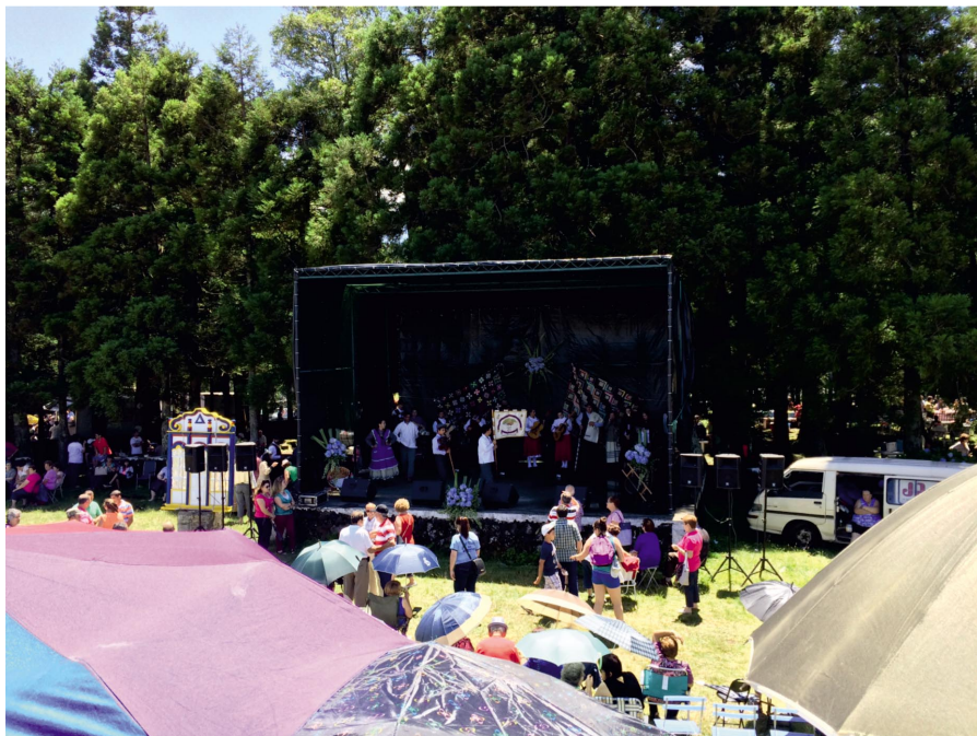
Figura 1.2 Festival do Emigrante