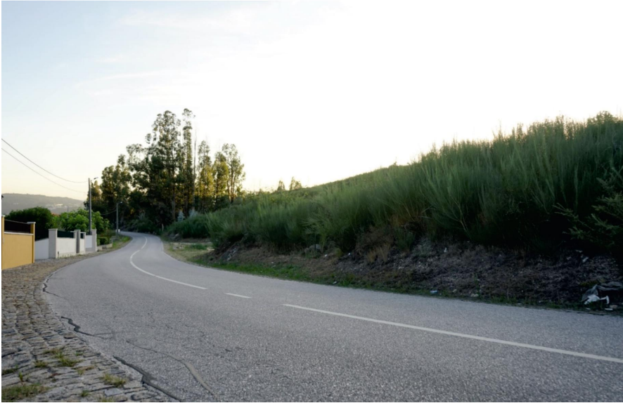
Figura 1.3 Lugares de regresso, norte de Portugal

Fonte: Fotografia de Lilliana Azevedo, 2021.